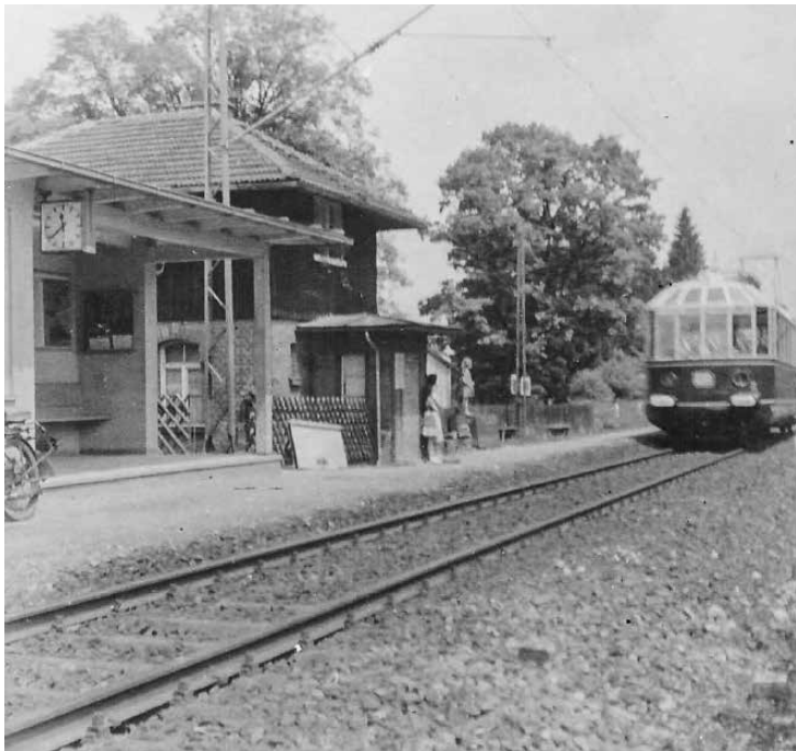
Gläserner Zug durchfährt Buchenhain