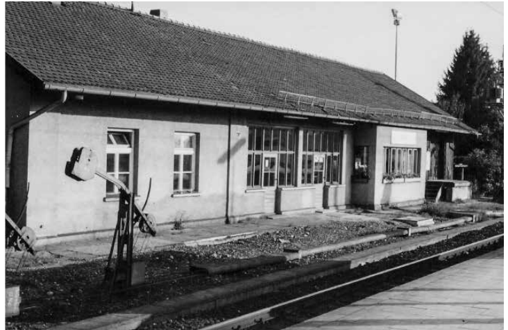
Ansicht Bhf. Baierbrunn von der Gleisseite