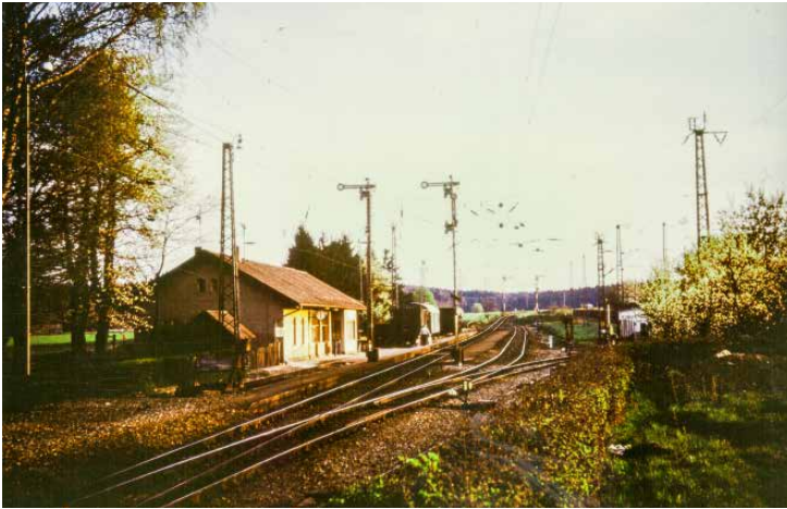
Bahnhof Baierbrunn vor der Aufnahme des S-Bahnbetriebs