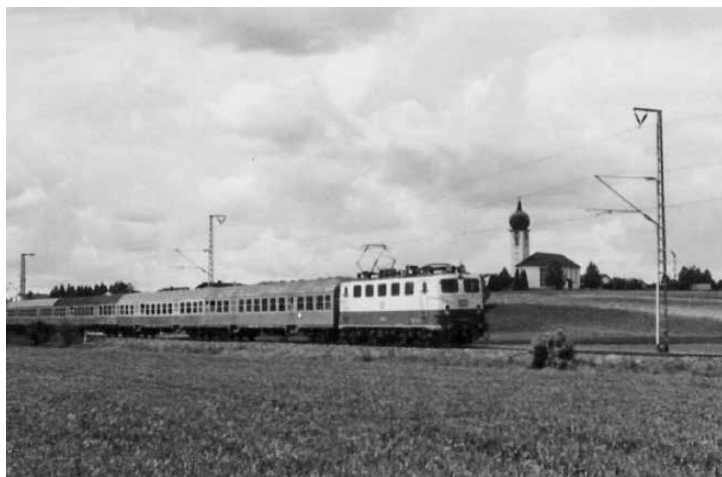
Zuggarnitur mit „Silberlingen“ und E 41 vor dem Baierbrunner Kirchberg