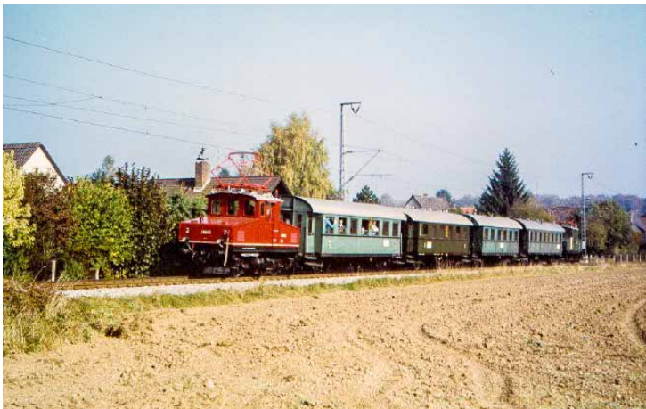
Personenson- derzug mit E 69 bei Buchenhain – im Vordergrund ist noch Acker, der Bauhof steht an dieser Stelle noch nicht.