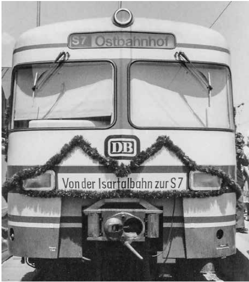
Eröffnungssonderzug S7 in Wolfratshausen