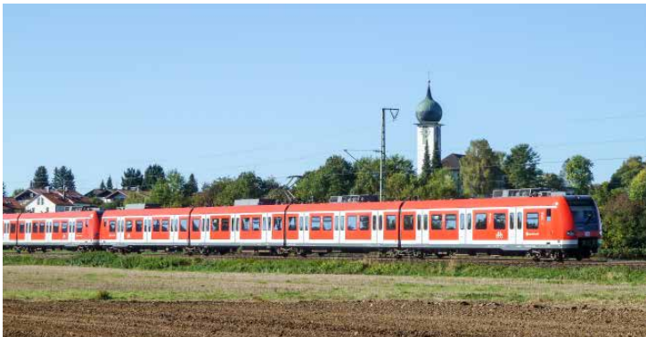
Die „neue“ S7: BR 423