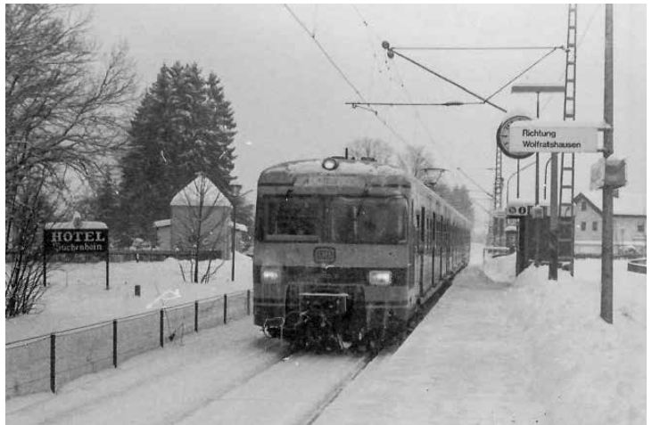
„Alle reden vom Winter“ – ET 420 am Haltepunkt Buchenhain