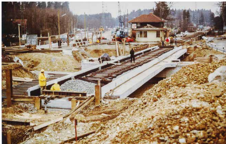
Bau der B 11-Unterführung in Buchenhain