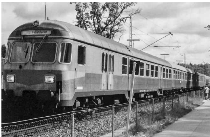
Zuggarnitur der S 10 am Haltepunkt Buchenhain