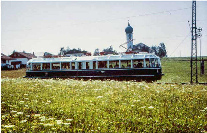
Der Gläserne Zug auf der Fahrt nach Wolfratshausen