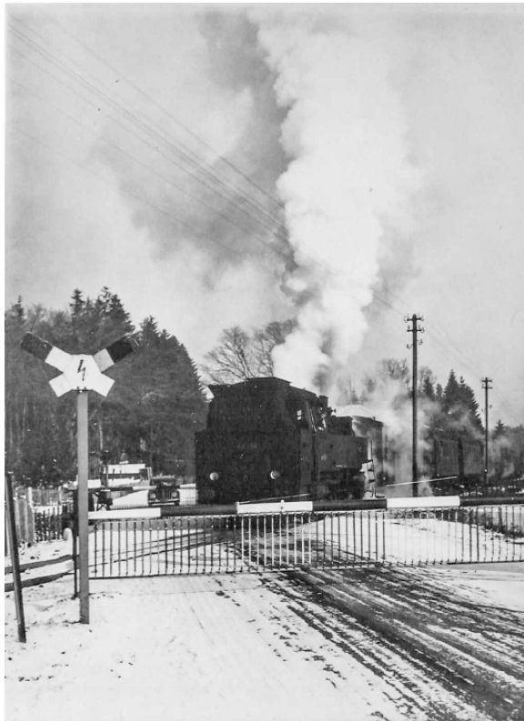
Personenzug mit BR 64 am Bahnübergang Buchenhain

Vor der Stilllegung der Strecke nach Beuerberg ist ein Aspekt bemerkenswert: 1969 war Königsdorf noch als Standort für die olympische Ruderstrecke in der Diskussion – dafür war geplant, die Strecke bis Beuerberg zu elektrifizieren. Dazu kam es bekanntlich nicht.