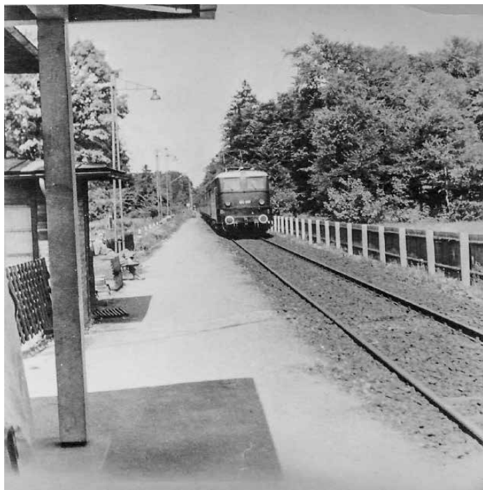
Zug mit E 41 fährt in Buchenhain ein