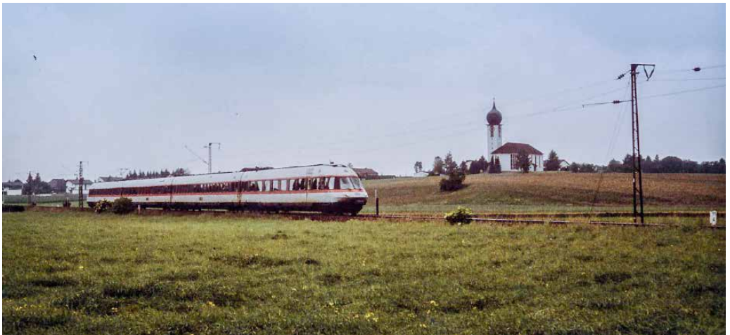
Sonderfahrt des ehemali- gen IC-Triebzuges Baureihe 403, genannt „Donald Duck“