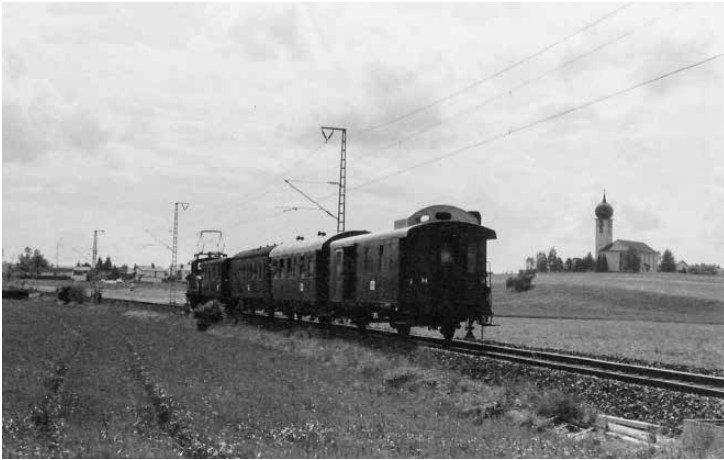
E 69 mit Personenson- derzug passiert den Baierbrunner Kirchberg Richtung Wolfratshausen