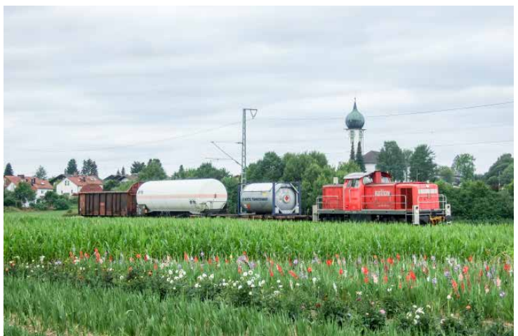
Güterzug vor dem Kirchberg