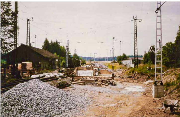
Umbau des Bhf. Baier- brunn zur S-Bahnstation